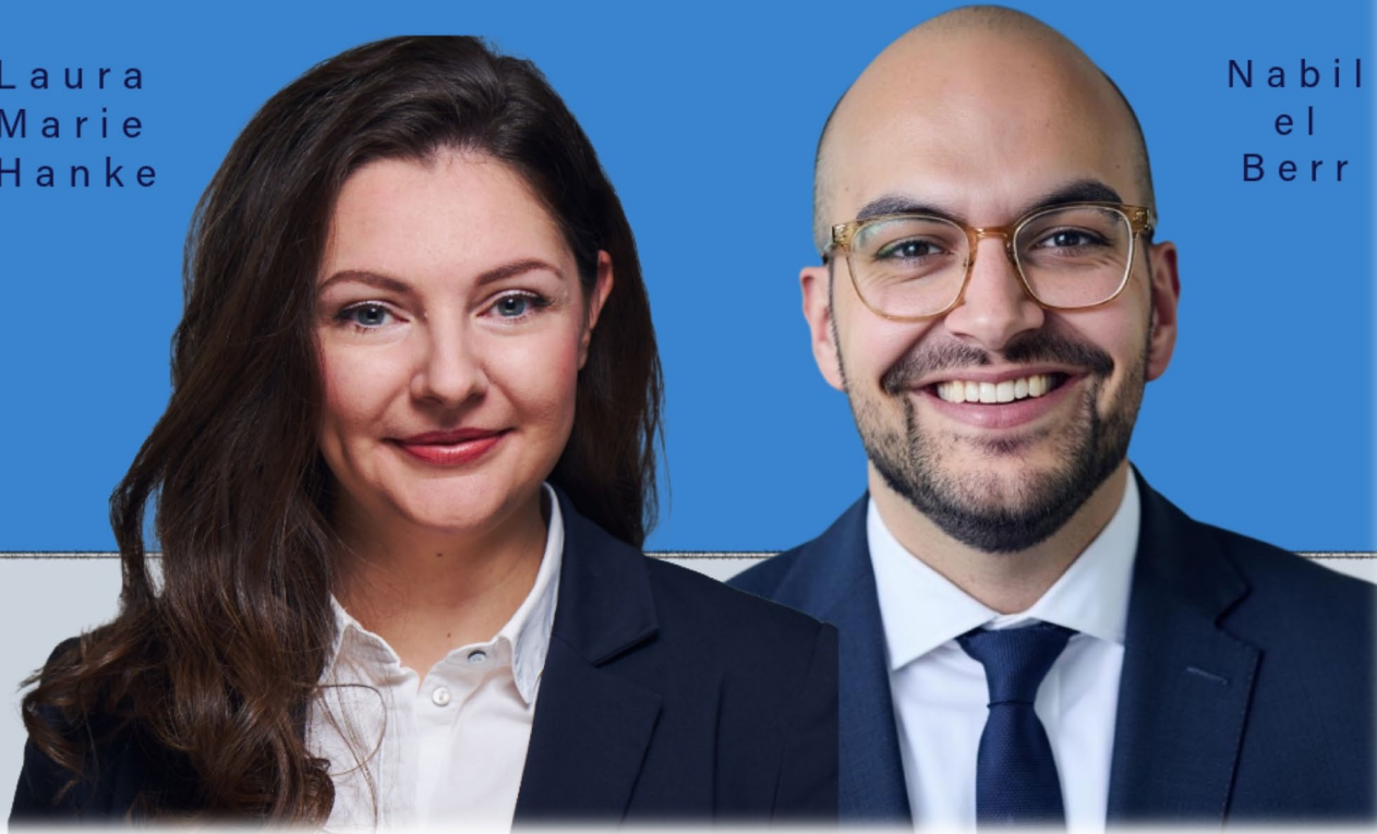
Nabil el Berr